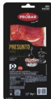
PRESUNTO TAPAS CURED HAM "TAPAS"