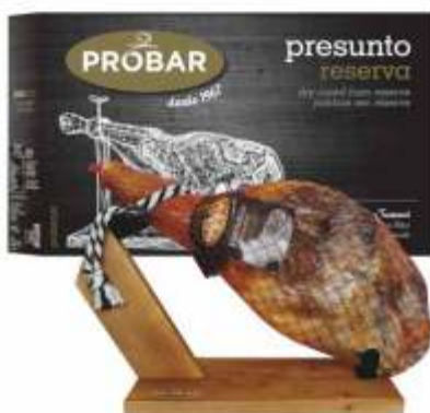
PRES. FUM. C/ OSSO RESERVA - C/ SUPORTE SMOKED CURED HAM ON THE BONE (RESERVA) - WITH A WOOD HOLDER