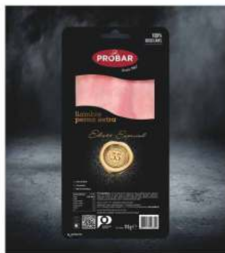
55 ANOS/ YEARS FIAMBRE PERNA EXTRA EXTRA COOKED LEG HAM

Aware to the needs of our consumers, we thought of a range of products that combined comfort and convenience. Our SLICED MEATS ready to eat anywhere, anytime with the same flavour and the same quality.