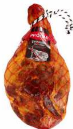
PRESUNTO FUMADO C/ OSSO SMOKED CURED HAM ON THE BONE