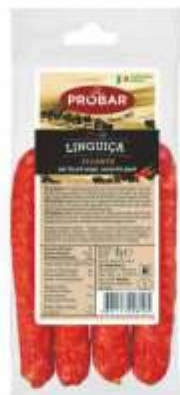
LINGUIÇA PICANTE SPICY FINE PORK SAUSAGE