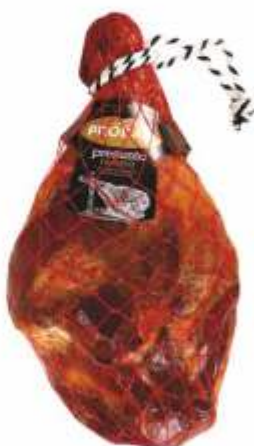
PRESUNTO FUMADO RESERVA C/ OSSO SMOKED CURED HAM ON THE BONE (RES.)