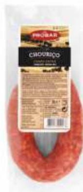
CHOURIÇO CARNE EXTRA SAUSAGE EXTRA

ref. 320211 | 2956112 | 1,380 kg ref. 320246 | 5601117202469 | 500 g ref. 320262 | 5601117202629 | 200 g