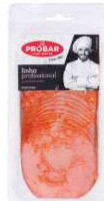
FOOD SERVICE PAIO YORK ROLLED YORK HAM

ref. 321315 | 5601117213151 | 800 g ref. 321319 | 5601117213199 | 500 g