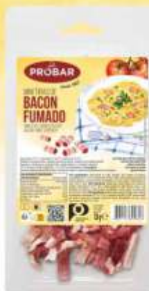
MINI TIRAS DE BACON FUMADO MINI SLICES SMOKED BACON