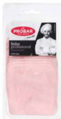
FOOD SERVICE - BOA ESCOLHA FIAMBRE HAM