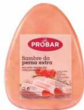
FIAMBRE DA PERNA EXTRA EXTRA COOKED LEG HAM

ref. 310315 | 2956107 | 3,850 kg ref. 310316 | 2956108 | 5,550 kg