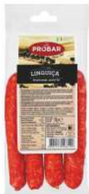
LINGUIÇA FINE PORK SAUSAGE

Our range of SAUSAGES is perhaps the one that concentrates the most traditional products in our country. Over the years we have travelled through our regions to learn more about their traditions and to be able to make the best products while respecting the know-how of each region.