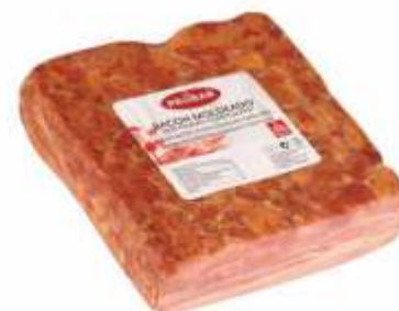
BACON FUMADO MOLDEADO MOLDED SMOKED BACON

ref. 331012 | 2956003 | 190 g ref. 331018 | 560117310188 | 190 g