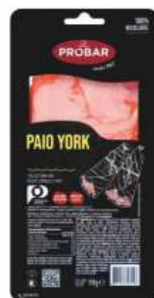
PAIO YORK ROLLED YORK HAM