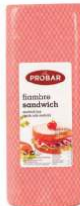
FIAMBRE SANDWICH BARRA SANDWICH HAM LOAF

ref. 310311 | 2956032 | 5,550 kg ref. 310314 | 2956079 | 3,850 kg ref. 310317 | 2956044 | 4,730 kg