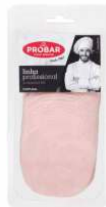
FOOD SERVICE FIAMBRE PERU TURKEY HAM