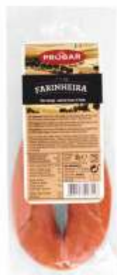
FARINHEIRA FLOUR SAUSAGE

ref. 320611 | 2956072 | 1,230 kg ref. 320617 | 5601117206177 | 200 g