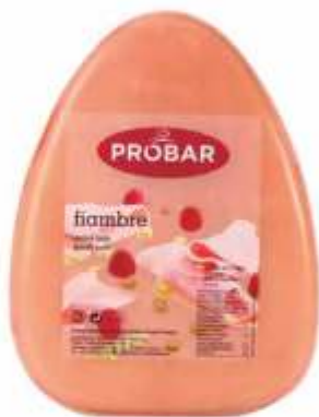
FIAMBRE COOKED HAM

ref. 310211 | 2956031 | 3,850 kg ref. 310212 | 2956043 | 5,550 kg