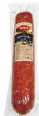
CHOURIÇÃO EXTRA LARGE SMOKED SAUSAGE EXTRA

ref. 320711 | 2956103 | 1,000 kg ref. 320714 | 5601117207143 | 160 g