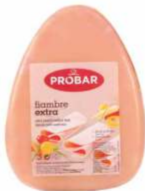
FIAMBRE EXTRA EXTRA QUALITY COOKED HAM

ref. 310211 | 2956031 | 3,850 kg ref. 310212 | 2956043 | 5,550 kg