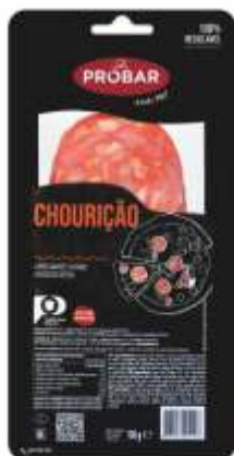
CHOURIÇÃO LARGE SMOKED SAUSAGE