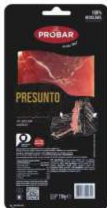
PRESUNTO CURED HAM