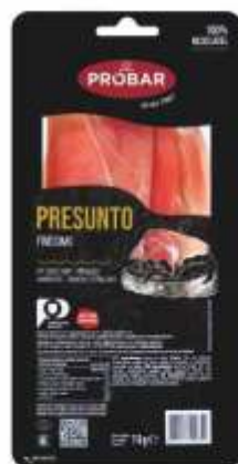
PRESUNTO FINÍSSIMOS CURED HAM THIN SLICES