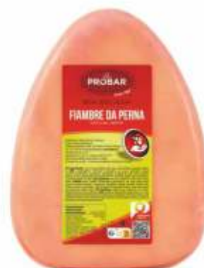
BOA ESCOLHA FIAMBRE DA PERNA COOKED LEG HAM

ref. 310243 | 2926386 | 3,850 kg ref. 310244 | 2956089 | 5,550 kg