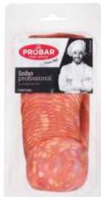
FOOD SERVICE - BOA ESCOLHA CHOURIÇÃO LARGE SMOKED SAUSAGE

ref. 321315 | 5601117213151 | 800 g ref. 321319 | 5601117213199 | 500 g