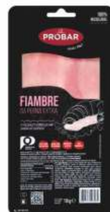
FIAMBRE DA PERNA EXTRA EXTRA QUALITY LEG HAM