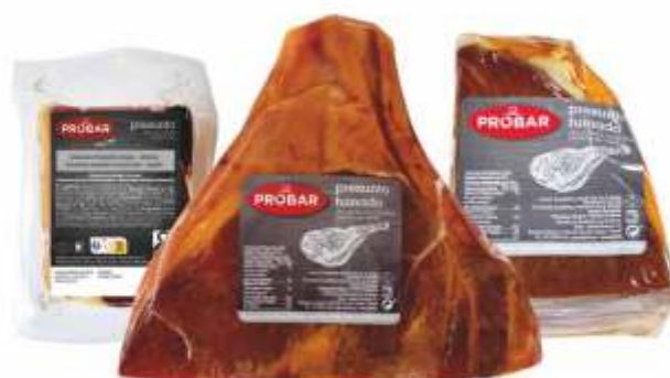
PRESUNTO FUMADO S/ OSSO BONELESS SMOKED CURED HAM

ref. 340122 | 2956059 | 2,900 kg ref. 340123 | 2956035 | 1,250 kg