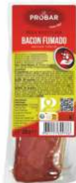
BOA ESCOLHA BACON FUMADO - PEDAÇOS SMOKED BACON - PIECES

ref. 330911 | 2953418 | 3,670 kg ref. 330913 | 2953419 | 1,740 kg