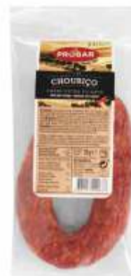
CHOURIÇO CARNE EXTRA PICANTE EXTRA SPICY SAUSAGE