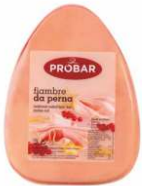
FIAMBRE DA PERNA COOKED LEG HAM

ref. 310315 | 2956107 | 3,850 kg ref. 310316 | 2956108 | 5,550 kg