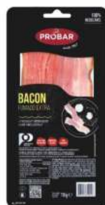
BACON FUMADO EXTRA EXTRA QUALITY SMOKED BACON