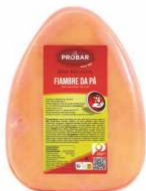
BOA ESCOLHA FIAMBRE DA PÁ COOKED SHOULDER HAM

ref. 310243 | 2926386 | 3,850 kg ref. 310244 | 2956089 | 5,550 kg