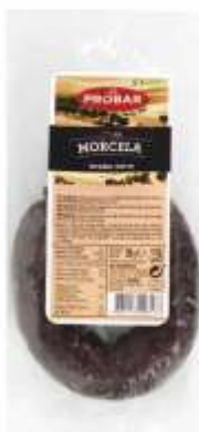
MORCELA BLACK PUDDING

ref. 320611 | 2956072 | 1,230 kg ref. 320617 | 5601117206177 | 200 g