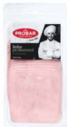
FOOD SERVICE FIAMBRE DA PERNA EXTRA EXTRA QUALITY LEG HAM