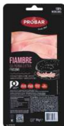
FIAMBRE DA PERNA EXTRA FINÍSSIMOS EXTRA QUAL. COOKED LEG HAM THIN SLICES