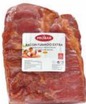
BACON FUMADO EXTRA EXTRA QUALITY SMOKED BACON

ref. 331011 | 2956013 | 3,330 kg ref. 331013 | 2956014 | 1,660 kg