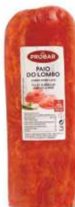
PAIO DO LOMBO SMOKED LOIN SAUSAGE