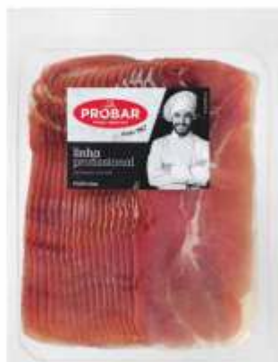
FOOD SERVICE PRESUNTO CURED HAM