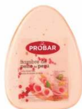
FIAMBRE PEITO DE PERU TURKEY BREAST HAM

ref. 310215 | 2956105 | Peso: 3,850 kg ref. 310216 | 2956106 | Peso: 5,550 kg