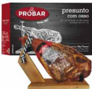
PRESUNTO FUM. C/ OSSO - C/ SUPORTE SMOKED CURED HAM ON THE BONE - WITH A WOOD HOLDER