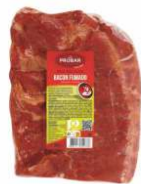
BOA ESCOLHA BACON FUMADO SMOKED BACON

ref. 330911 | 2953418 | 3,670 kg ref. 330913 | 2953419 | 1,740 kg