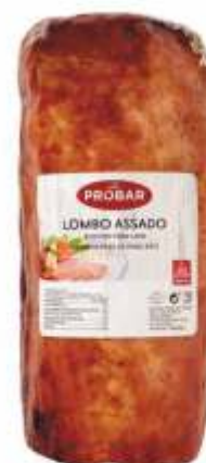
LOMBO ASSADO ROASTED PORK LOIN