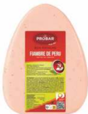
BOA ESCOLHA FIAMBRE DE PERU TURKEY HAM

ref. 310348 | 2956074 | 3,850 kg ref. 310349 | 2944541 | 5,550 kg