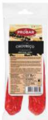
CHOURIÇO CORRENTE STANDARD SAUSAGE

ref. 320211 | 2956112 | 1,380 kg ref. 320246 | 5601117202469 | 500 g ref. 320262 | 5601117202629 | 200 g