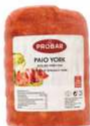
PAIO YORK - METADES ROLLED YORK HAM - HALVES

Following traditional portuguese recipes and using new technologies, we prepared the best SMOKED products. We use traditional smokers which give our products an unmistakable flavour that makes us travel back to the old days.